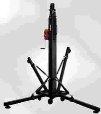
Fenix ELV-230/5 BGV C1

Installation ..... fliegend am Truss mit Motorkettenzügen oder am Truss mit Traversenliften