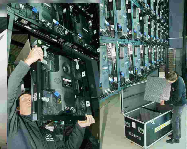
Dank der leichten und passgenauen Aluminium-Cabinets mit QuickLock-Verriegelung ist der Komplettscreen in wenigen Stunden betriebsfertig aufgebaut.